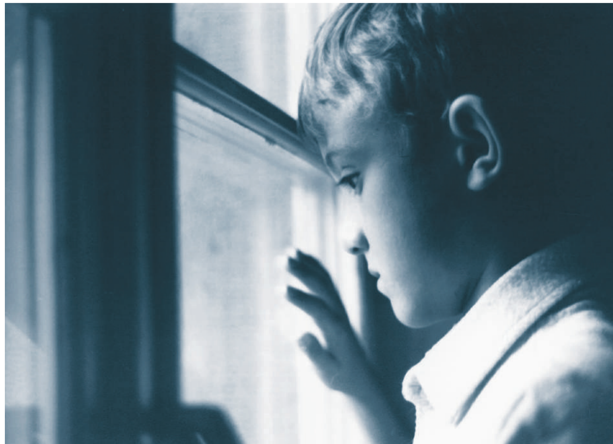
VERBOTENE KINDER: Für Saisoniers war der Familiennachzug in die Schweiz nicht erlaubt. Deshalb brachten die Eltern ihre Kinder heimlich in die Schweiz, wo sie versteckt lebten.

Billig wäre es gewesen, wenn Todisco eine platte Anklage über das unmenschliche Saisonierstatut formuliert hätte. Vielmehr aber interessiert er sich dafür, wie das Kind mit seiner Situation zurechtkommt, wie es Phantasien entwickelt, Beziehun-