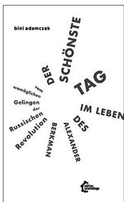
Bini Adamczak: Der schönste Tag im Leben des Alexander Berkman. Vom möglichen Gelingen der Russischen Revolution . edition assemblage, Münster 2017.