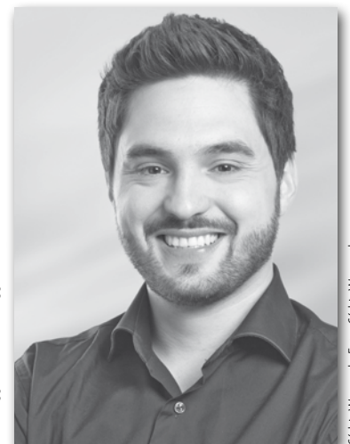
Cédric Wermuth, Foto: Cédric Wermuth